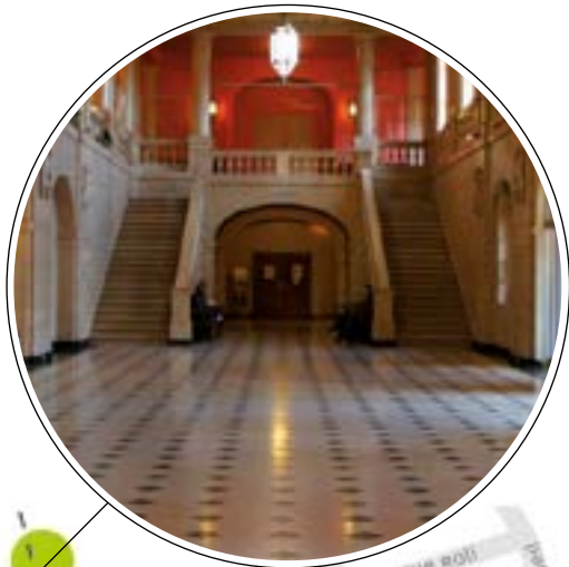
Accès à la Salle Konrad Adenauer (1 re étage) depuis le hall d'entrée.